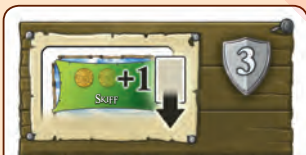
Kupec (po 1 v každé barvě)

Pokud si ve fázi Obchodování a najímání postav vezmete loď v barvě kupce, smíte si z nabídky v přístavu vzít další kartu dle své volby podle jinak obvyklých pravidel. Nejste-li zrovna aktivním hráčem, musíte za tuto dodatečnou kartu zaplatit aktivnímu hráči rovněž 1 minci.