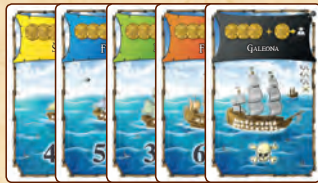
10 lodí, po 2 v každé barvě