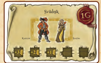
18 velkých karet kontraktů