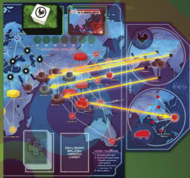
Šíření pandemie z venkovského pole (černá) nebo na něj (červená).

Tento scénář lze kombinovat i s použitím žetonů prevence, scénáři Stav ohrožení, Zákeřný virus i všemi scénáři z ostatních rozšíření. Sám o sobě dělá tento scénář hru v něčem obtížnější, v něčem snazší, takže celková obtížnost zůstává víceméně stejná.