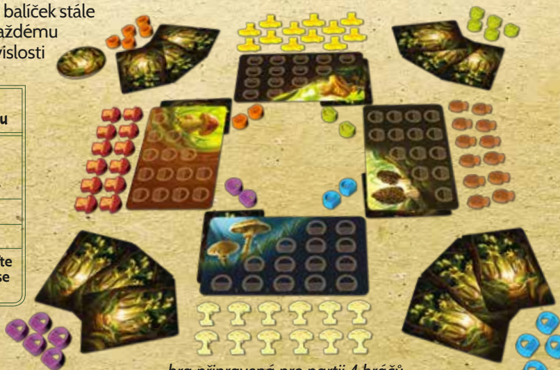
hra připravená pro partii 4 hráčů

Hráč, který byl jako poslední na houbách, začíná. Přidejte mu žeton začínajícího hráče.