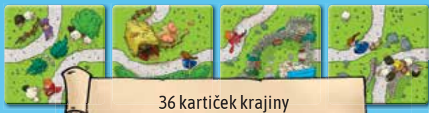
36 kartiček krajiny

Tato pravidla hry, 36 kartiček krajiny, 32 figurek dětí (8 v každé ze čtyř barev).